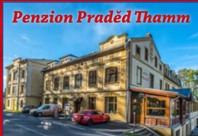
Penzion Praděd Thamm

Celoroční sleva na ubytování v penzionu je 10 %