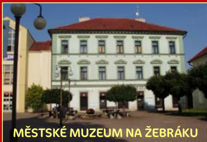
MĚSTSKÉ MUZEUM NA ŽEBRÁKU

Sortiment služeb: Stálé expozice "Z historie města Žebráka" a "Galerie Jaroslava Hněvkovského" a sezónní výstavy Celoroční sleva 25 %, na běžné vstupné na prohlídku expozic a výstav pro individuální návštěvníky