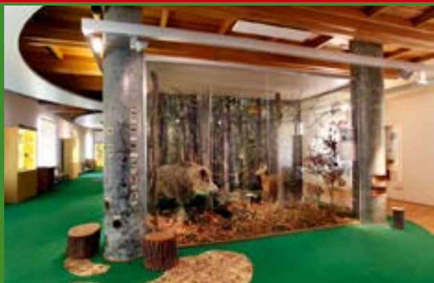
VLASTIVĚDNÉ MUZEUM V OLOMOUCI

Celoroční sleva na stálou expozici i výstavy VMO 50 %