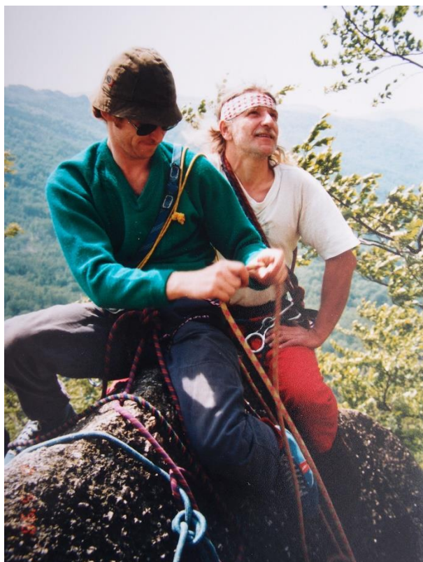
1998 - 16.ročník