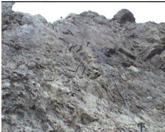
a výše již snadný hřebínek A,B.