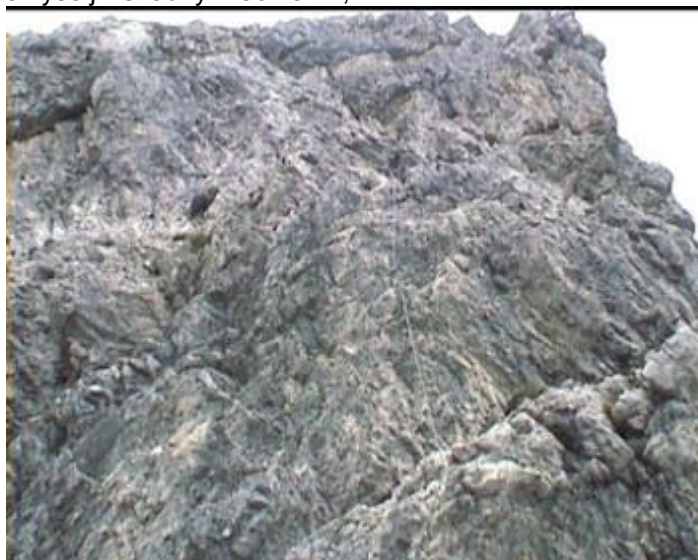
Nedaleko vrcholu z rokle strmě C a pak již snadno A na vrchol Lachenspitze 2130 m.

S vrcholu sestupujeme západním směrem a klesáme na cestu traverzující úbočí. Tou do sedla. Ze sedla můžeme pokračovat na další vrcholy v hřebeni, nebo