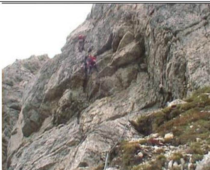
Nad ním úsek C