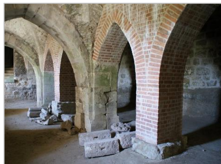
krypta cisterciáckého kláštera