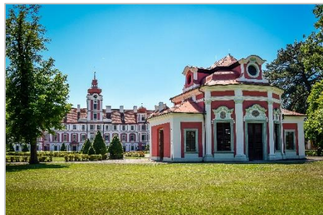
zámek Mnichovo Hradiště

Zřícenina Zásadka je přístupná celoročně bez vstupného. Návštěvu tohoto s láskou opečovávaného místa, nebudete zklamáni. Vždy je zde připravené dřevo na oheň, stejně tak i napichováky, takže buřty a sirky s sebou, budete-li