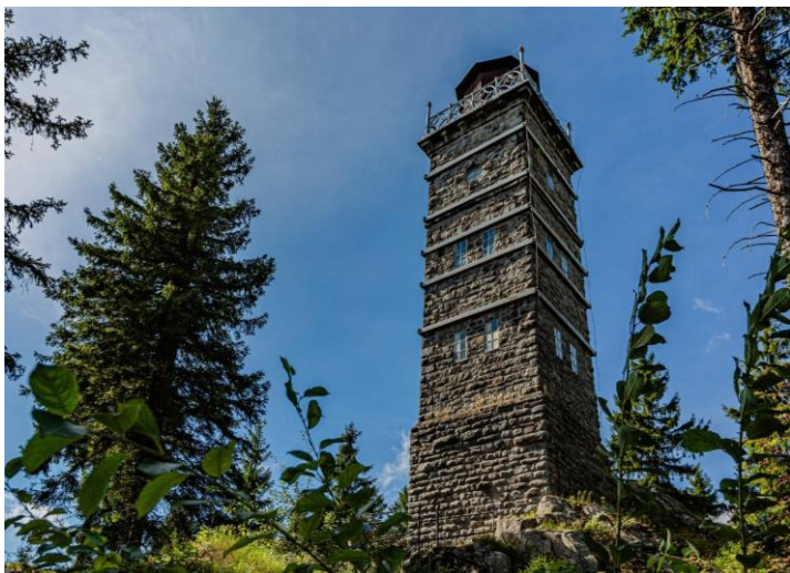
Rozhledna Pajndl

Aneb přes rozhlednu Pajndl a Křížový vrch do Nejdku