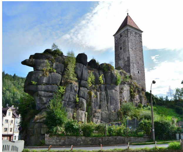
Černá věž hradu Nejdk