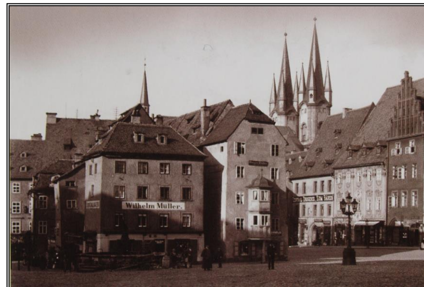
Chebský Špalíček kolem r. 1900.

Webová stránka KČT, oblast Karlovarský kraj: www.kctkv.cz