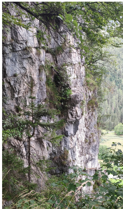
poslední část cesty stěnou

Cesta je psána jako B/C, Ten začátek B mi připadá trochu těžký – ale možná je to obvyklá finta na počátku. Jsou to velké kramle. B/C je asi trochu strmější. Asi v polovině je zde trojlanový most + jistící lano. Dost se houpe. Nástup je trochu krkolomný. Na druhé straně vzhůru, traverz vlevo , dřevěná lávka, pak dost strmě vzhůru B/C a pak opět traverz - dřevěné ,celkem úzké lávky Ješ zde dost umělých pomůcek, ale některé kroky jsou dost dlouhé. Je třeba využívat i přirozené stupy a chyty. 18:21 h Pak traverz a sestup vlevo okolo skály a návrat po výstupové cestě.