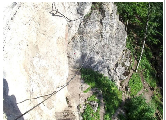
lanový most a stěnka s nástupem