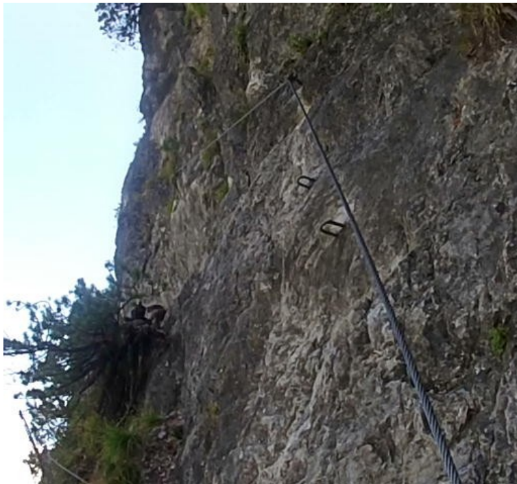
Strmý sestup B

Sestup pak je komínkem B a B, posléze A dolů.