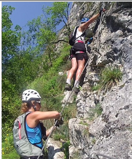
U odbočky cesty 8