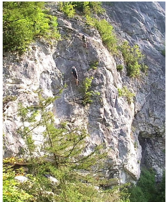
dolní část cesty č. 3

Nad prvním úsekem C odbočuje vpravo krátká spojka č. 8 Laserer Quergang, kterou se můžeme dostat na horní – snazší – část cesty č. 7 – obtížnost D.