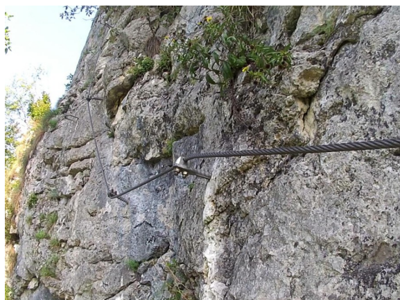
konec traverzu nad odbočkou cesty č.8

Cesta č. 3 Karin pokračuje snadněji vlevo a opět náročný úsek obtížnosti C.