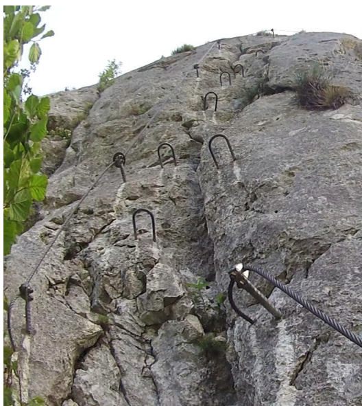
Horní úsek C

Cesta č. 3 Karin pokračuje snadněji vlevo a opět náročný úsek obtížnosti C.