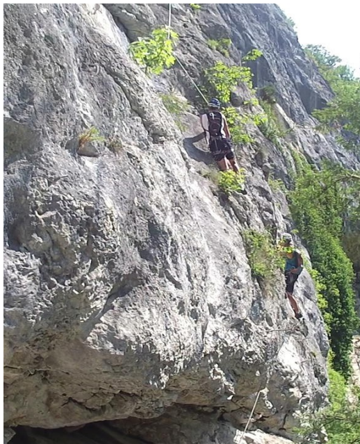
U nástupu cesty č. 3

Přes platformu k nástupu cesty č. 3 Karin Klettersteig. Cesta razantně stoupá s obtížností C. (Je to poměrně těžké C, pokud porovnáváme např. s cestou č. 5 Trattenbacher)