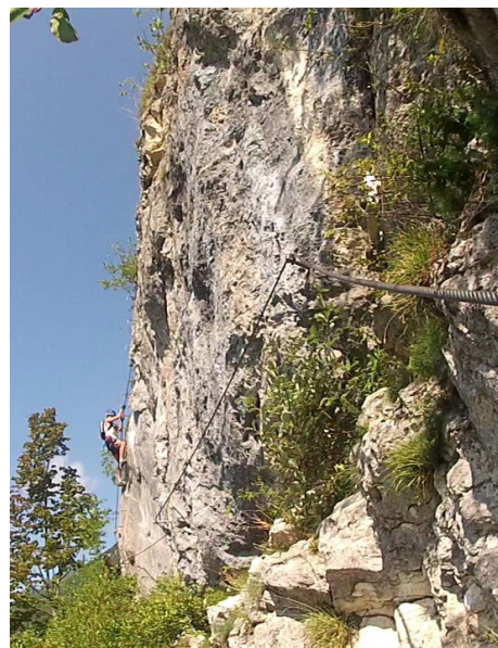
u napojení cesty č. 7

Poslední část cesty je již snadnější – obtížnost B/C.