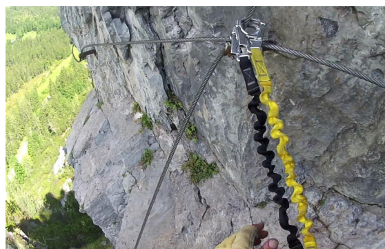
vyústění cesty C