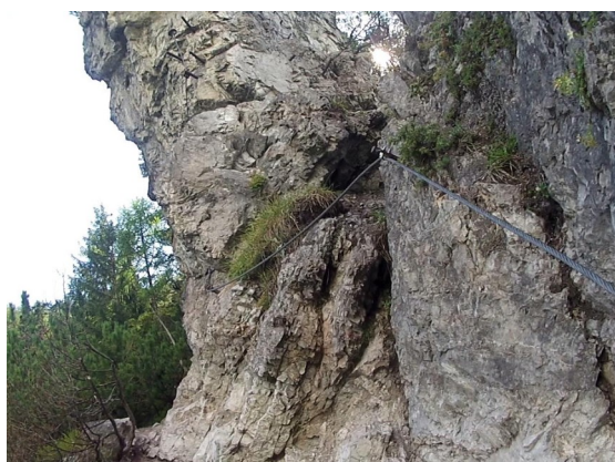
přístup k věži a cestě C zleva