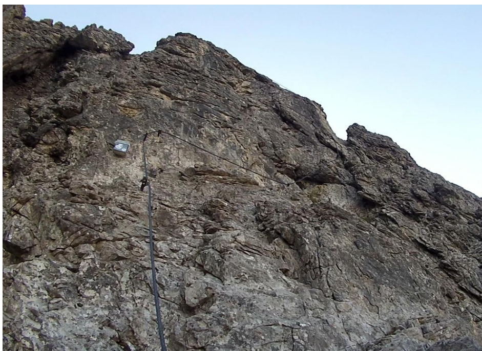
B u vrcholové schránky

Dostáváme se k nejtěžšímu místu cesty. Je jím převis D. Na pohled vypadá členitě, bezproblémově, ale prvý krok je hodně vysoký a zejména menší postavy bez gymnastických schopností mohou mít trochu problém.