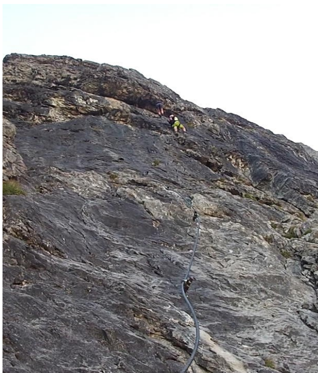
výše ve stěně