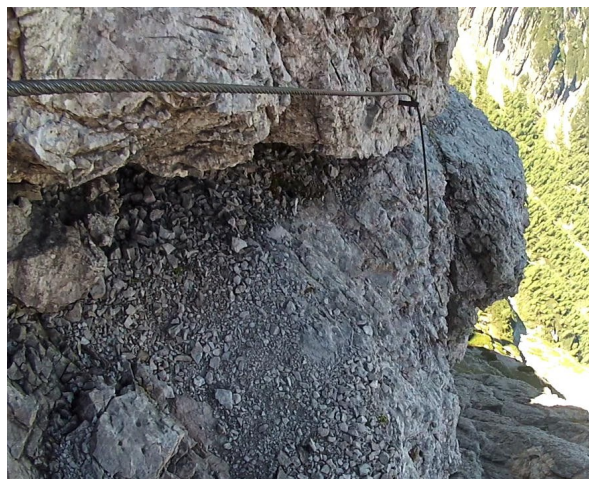
horní B/C – pohled zpět