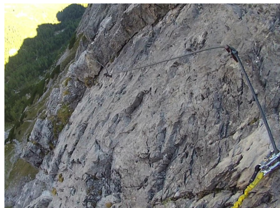
dolní část - pohled zpět