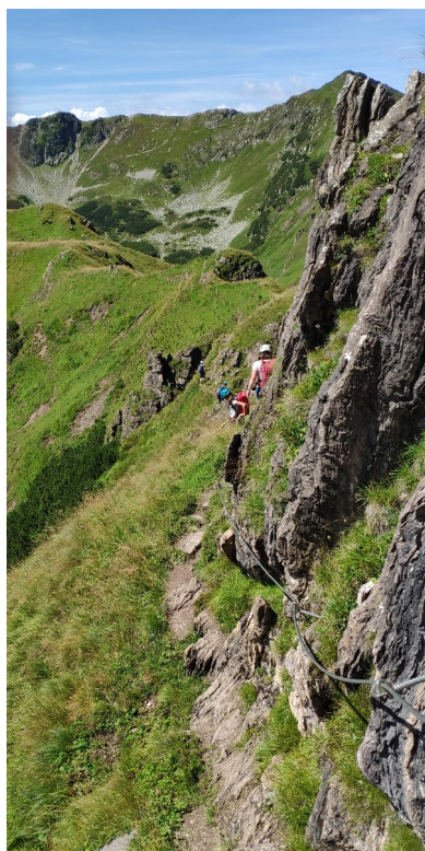
sestup-traverz na travnatý hřeben