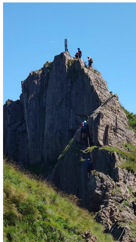
vrchol z travnatého hřebene