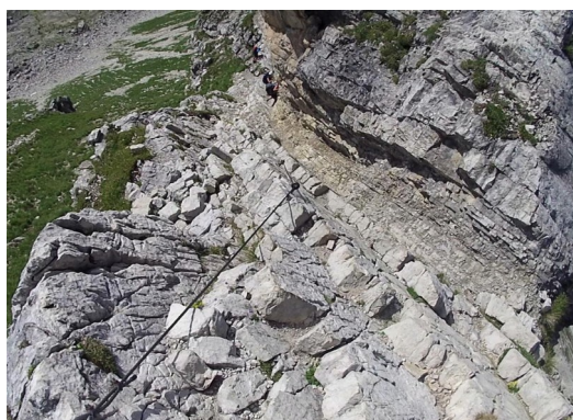
Šikmo klesající rampa

Vodorovný žebřík přes proláklinu. Po chvíli sestup šikmou lehce rozchrastanou rampou. Cesta pokračuje hřebenem dál a do sedla vede kramlový žebřík B/C. Před námi s objevuje skalnatě vyhlížející hřeben.