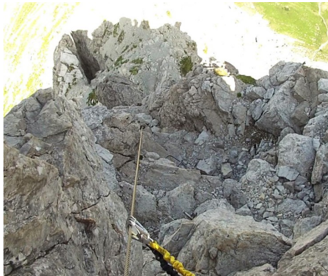
sestup s prvního vrcholu