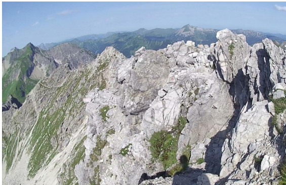
pokračování hřebene- sestup