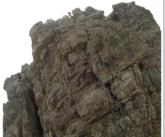
z dálky viditelný žebřík