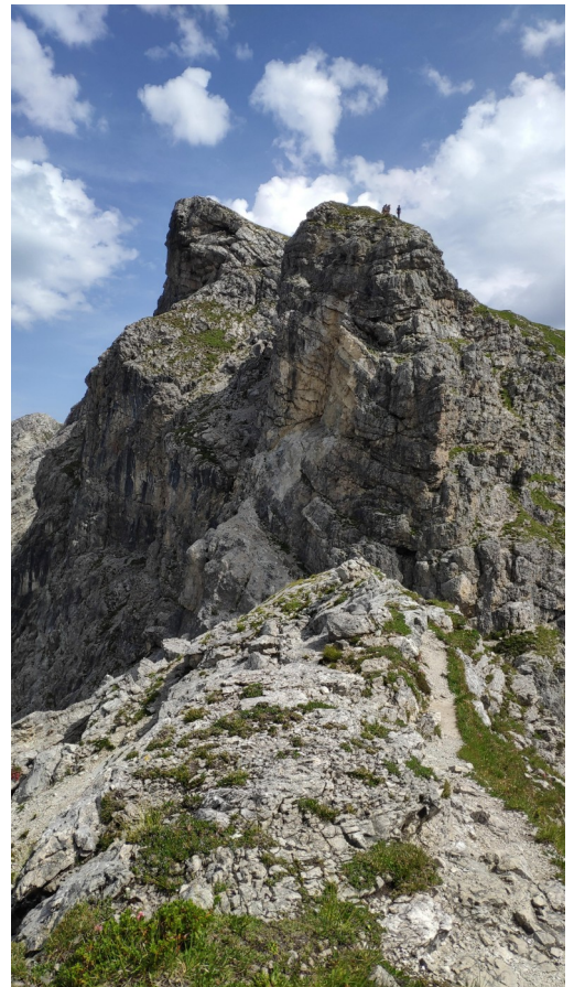
sestup s vrcholu – pohled zpět