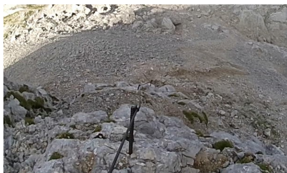
Na nástupem-pohled zpět