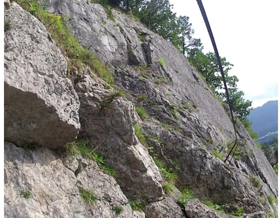
Nad lanovým mostem

Nahoře na sále je miniaturní lanové centrum a mají zde připraveny i další atrakce – např. Flying Fox.