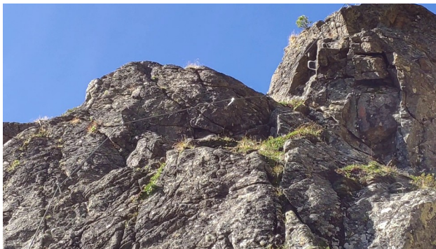
Nejtěžší část nad nástupem