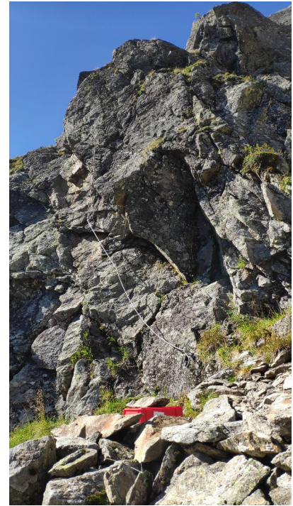
celkový pohled na nástup