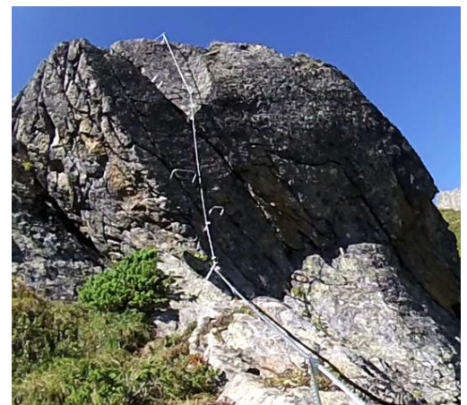
horní C s nepříjemným výlezem

Návrat zpět špatně zřetelnou pěšinou ke kříži a odtud pěšinou sestup ke cvičné cestě a odtud po nástupové cestě zpět k chatě.