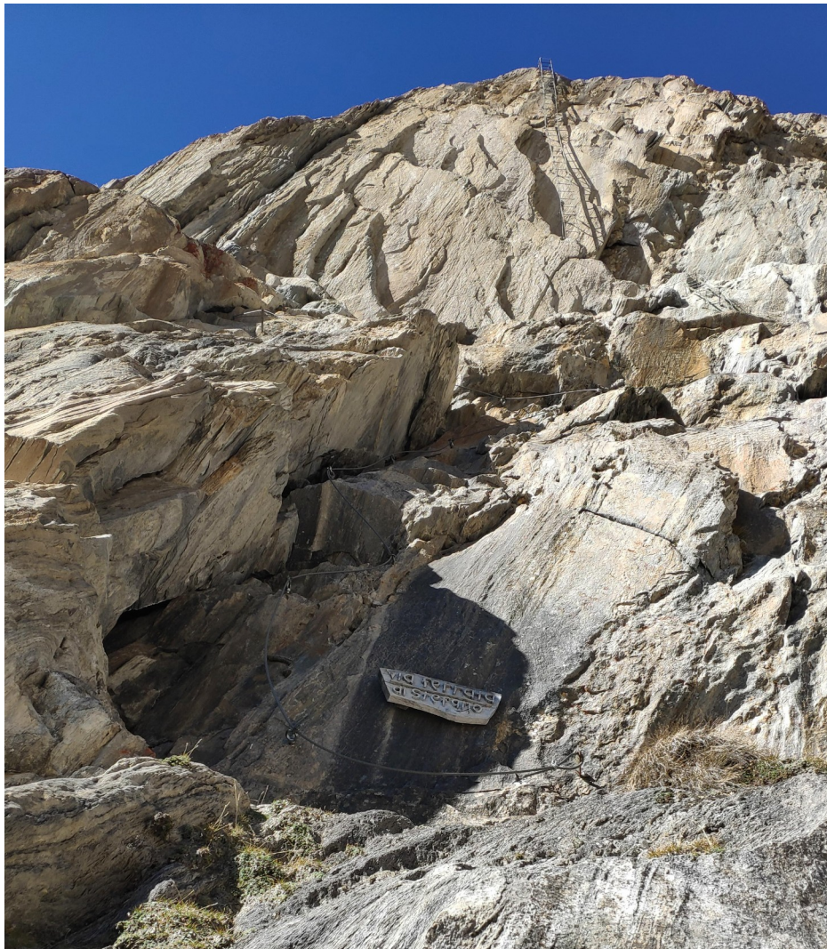
Nástup a část pod prvním žebříkem

Přímá cesta má obtížnost D/E. Ihned v úvodu je zde stěnka obtížnosti D, za ní následuje prvý, lehce převislý žebřík C/D a za ním druhý, 14 m dlouhý, ještě převislejší D/E. Od jeho konce odbočíme vpravo pod třetí žebřík.