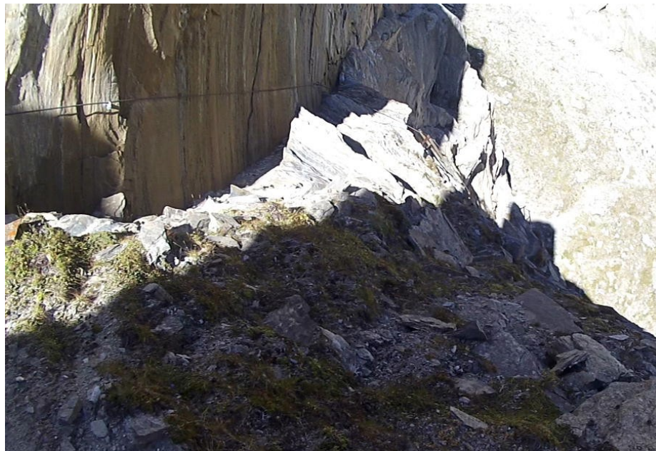
Napojení snazší varianty zprava

Do tohoto místa ústí také varianta obcházející úsek E o obtížnosti B. Ta zahrnuje dva žebříky.