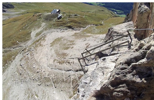
nad druhým žebříkem