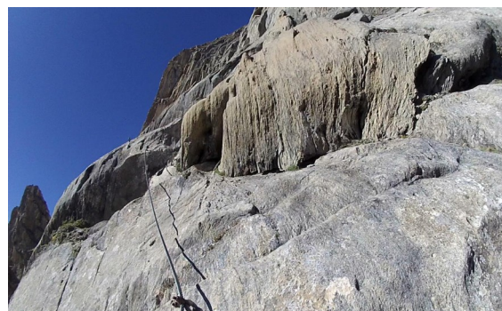
nad třetím žebříkem

Na něm následuje úsek B/C a C. Těžší místa jsou plotnovitá, bez stupů.