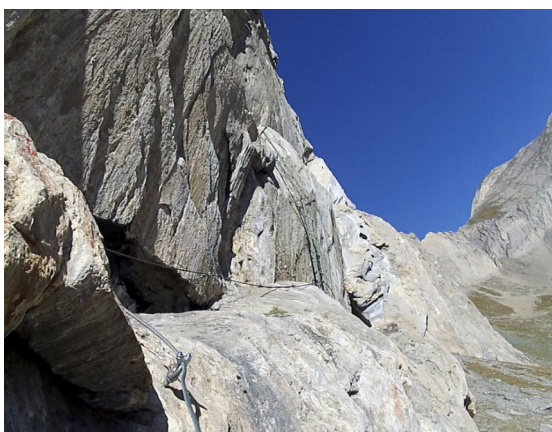
pod prvním žebříkem