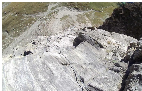
střední B/C – pohled zpět