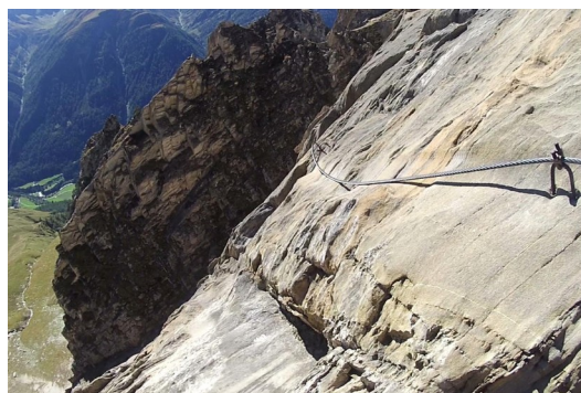
horní B/C – pohled zpět