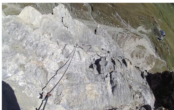
závěr cesty – pohled zpět