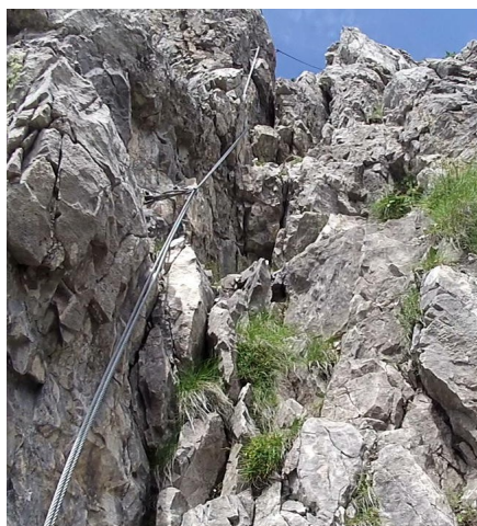
výšvih na hřeben