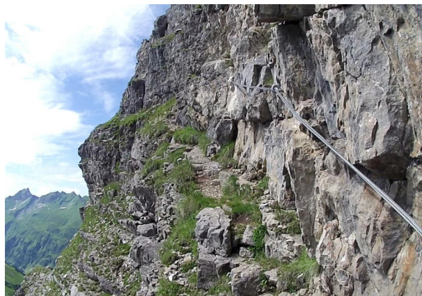
traverz – nad nástupem