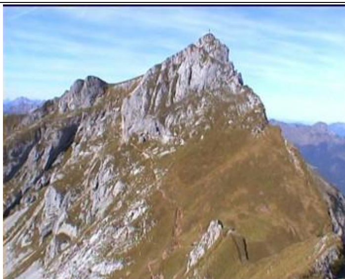
Hochiss: nástup z chodecké cesty vpravo a stěnkou C.