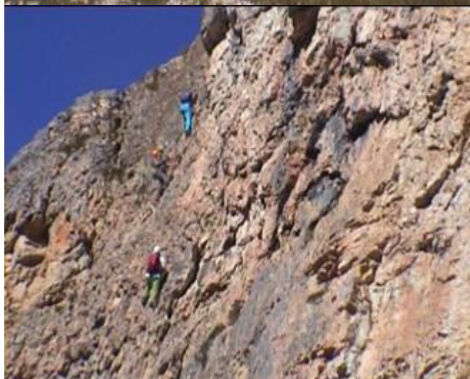
Celá spodní část stěny má obtížnost převážně C/D.