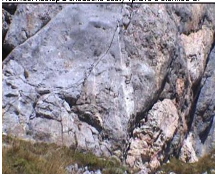
Následuje traverz A a nad ním plotnovitý úsek C/D.