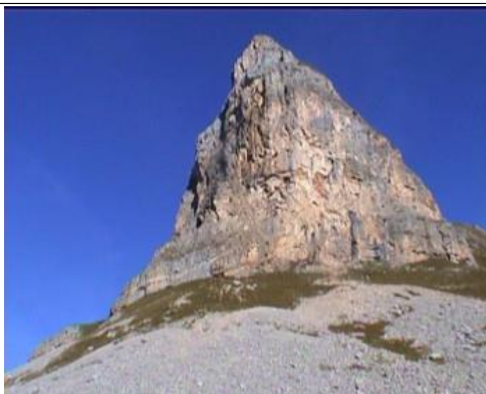
Rosskopf: tento výstup je asi z celé cesty nejhezčí.