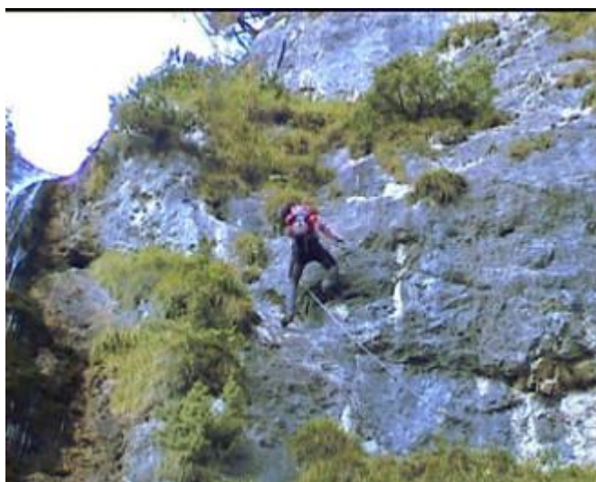
Cesta vede pod výrazný převis. Zde nějtěžší místo: traverz vpravo a pak vzhůru - vše D.