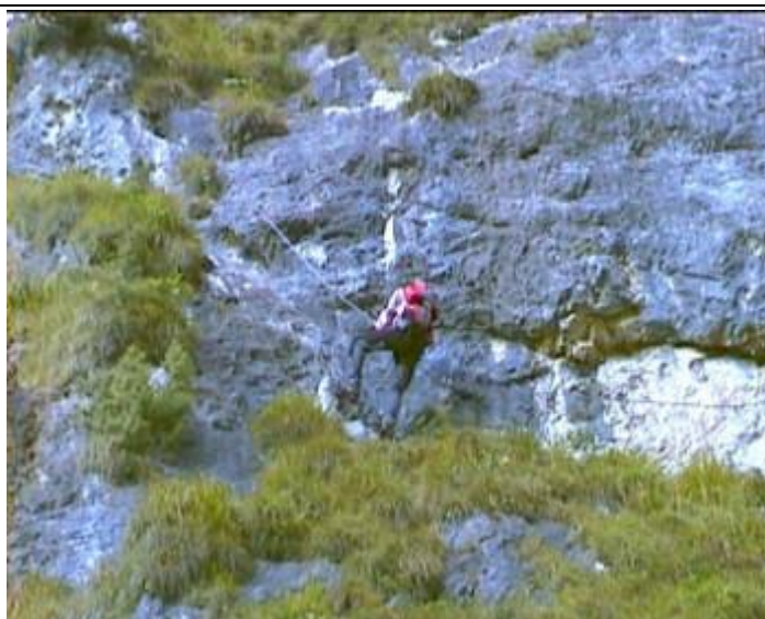
a dále stěnkami C.