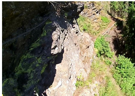
střední část – pohled zpět