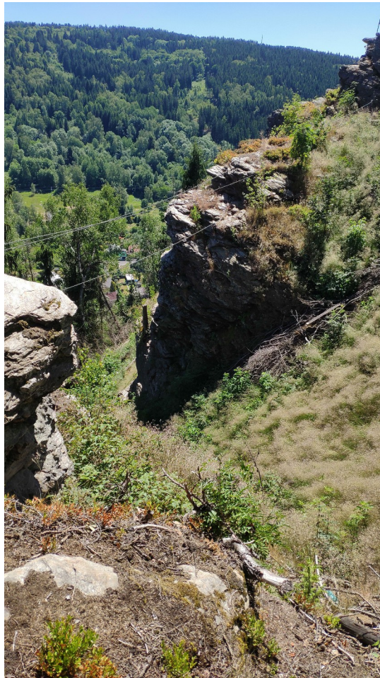
pohled zpět na lanový most

Cesta opět končí u vyhlídkové skalky. Z ní můžeme sestoupit asi 2 m a dostaneme se k začátku trojlanového lanového mostu. Po přechodu na třetí skálu cesta obkružuje skalisko zprava.