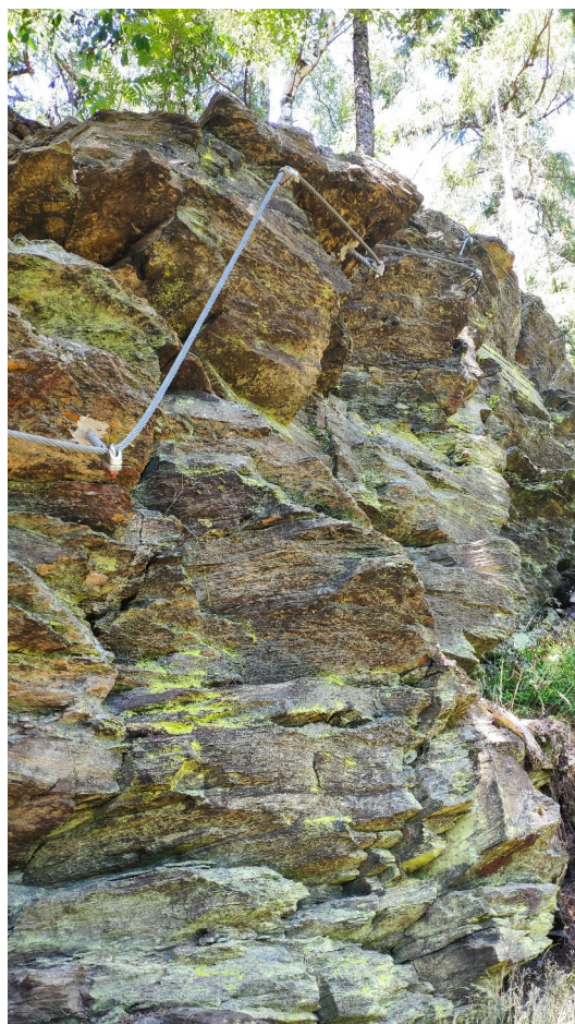
Cesta C - dolní část

Na obrázku vidíme, že lokalitu tvoří tři skály s vystrojenými cestami. Nejvíce vlevo je červeně značená feráta s uváděnou obtížností C. Jde o šikmo vzhůru stoupající cestu, která vede po výrazných stupech. Několik míst možná lehce vytlačujících podle volby stupu. Obtížnost spíše B/C.