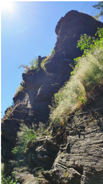
Věž se vzhůru jdoucí cestou D