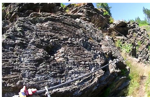
horní část - u konce