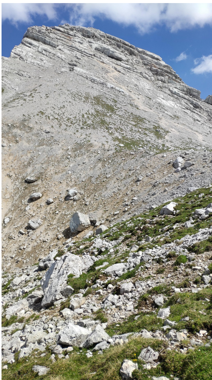
Pohled na Spitzmauer od konce klettersteigu.