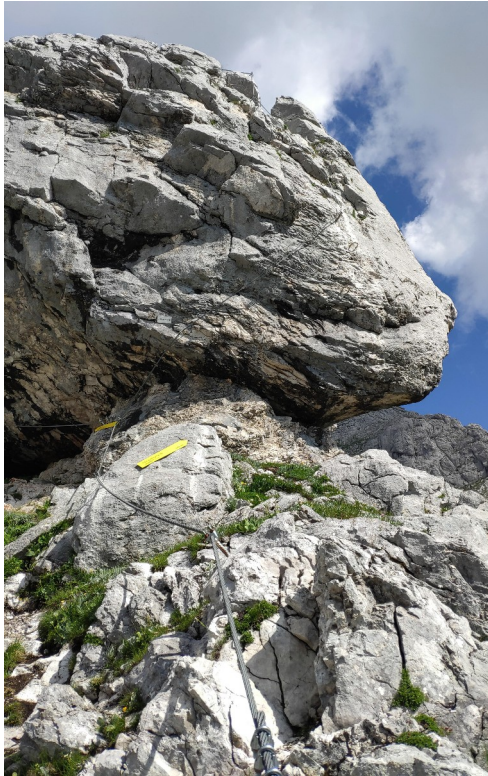
Klíčové místo D