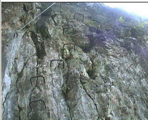
Stěnka C/D nad lanovými mosty