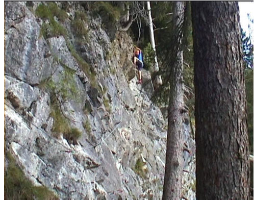
Závěrečný traverz a vlevo vzhůru

Od konce klettersteigu ještě kousek stoupáme, pak traverz po pěšince vpravo až na značenou cestu a tou velmi strmě dolů. Cesta je dost hlinitá a asi bude po dešti dost klouzat. Od nástupu zpět stejnou cestou.