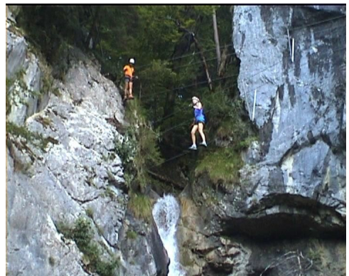
odbočující lanové mosty