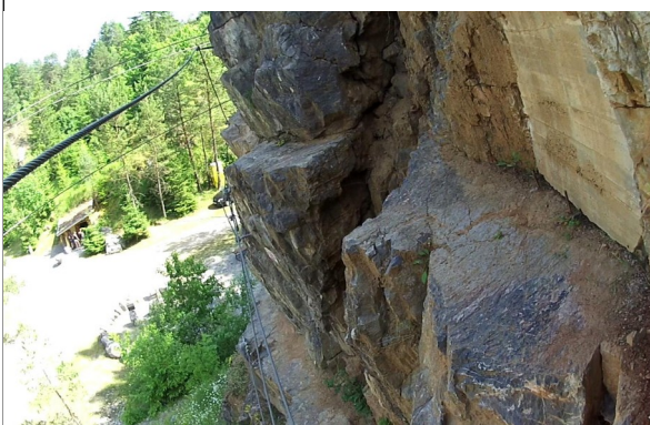
Počátek lanového mostu