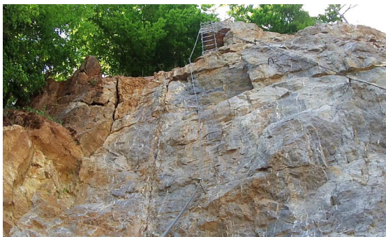
Cesta č. 1 a 2 – horní část