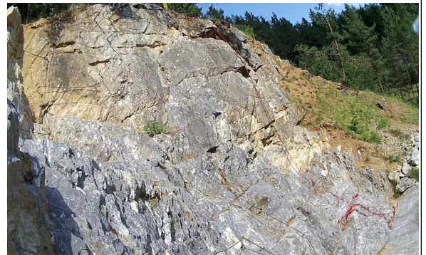
Pravá stěna – cesta 14