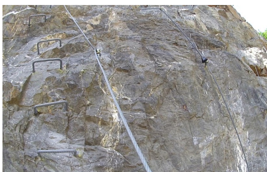
Dolní část cest vpravo od žebříku