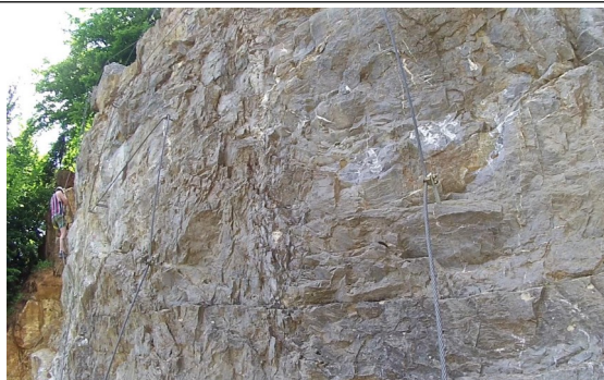
Cesty 3 a 4 střední část