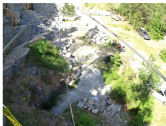
Lanový most 60 m