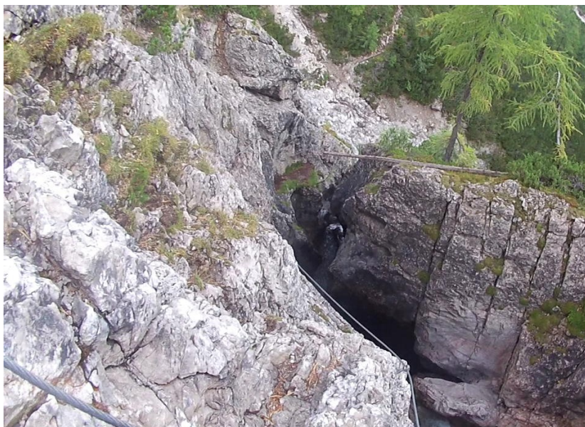
mezi druhým a třetím mostem

V protější stěně zpočátku snadněji B, posléze B/C ve stěně kaňonu, na konci s hladkou stěnkou C/D, přístup k třetímu mostu.