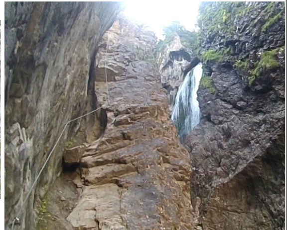
závěrečný pilíř – pohled zpět