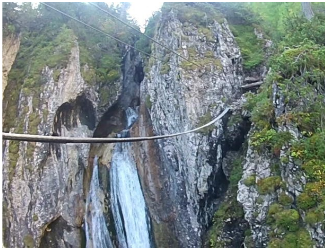
horní lanový most

Přes poslední čtvrtý most a za ním cesta končí.