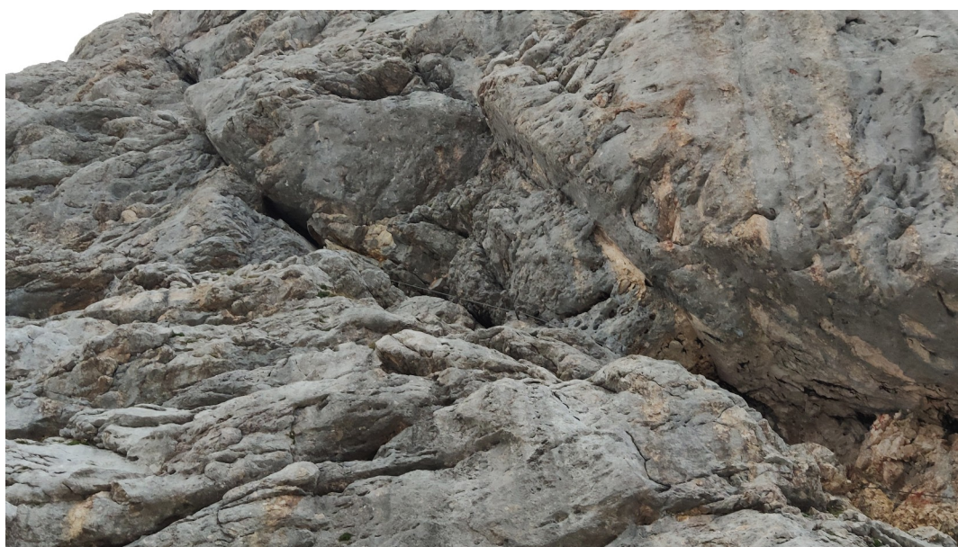
dolní část – rampa - detail