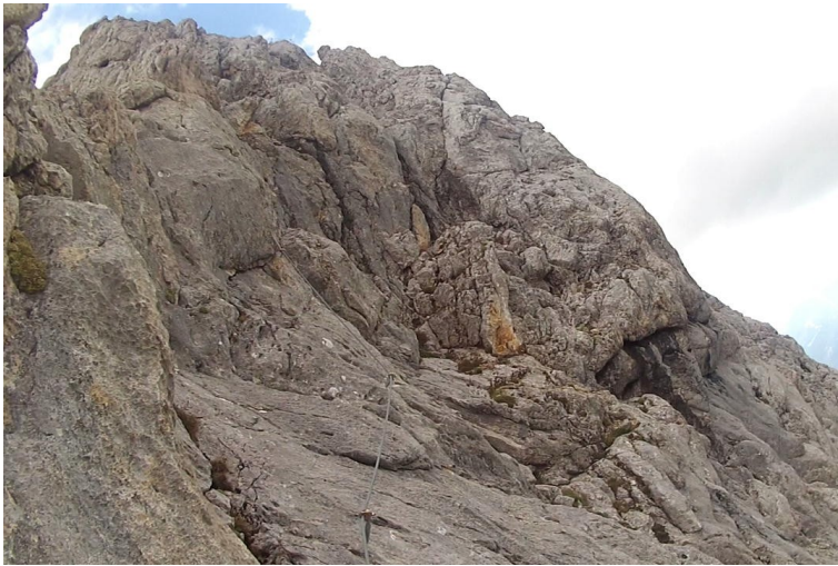
Plotnovitá stěna B/C.