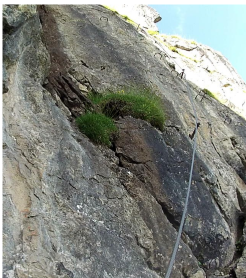
Pod 2- C/D