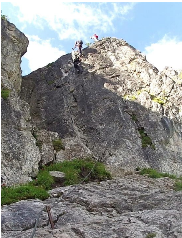
čtvrté C/D – asi nejtěžší místo celé cesty