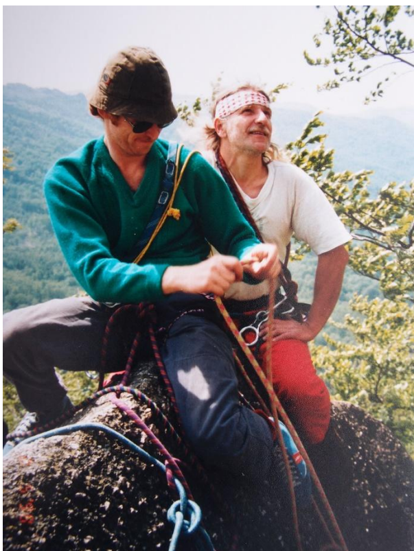
1998 - 16.ročník