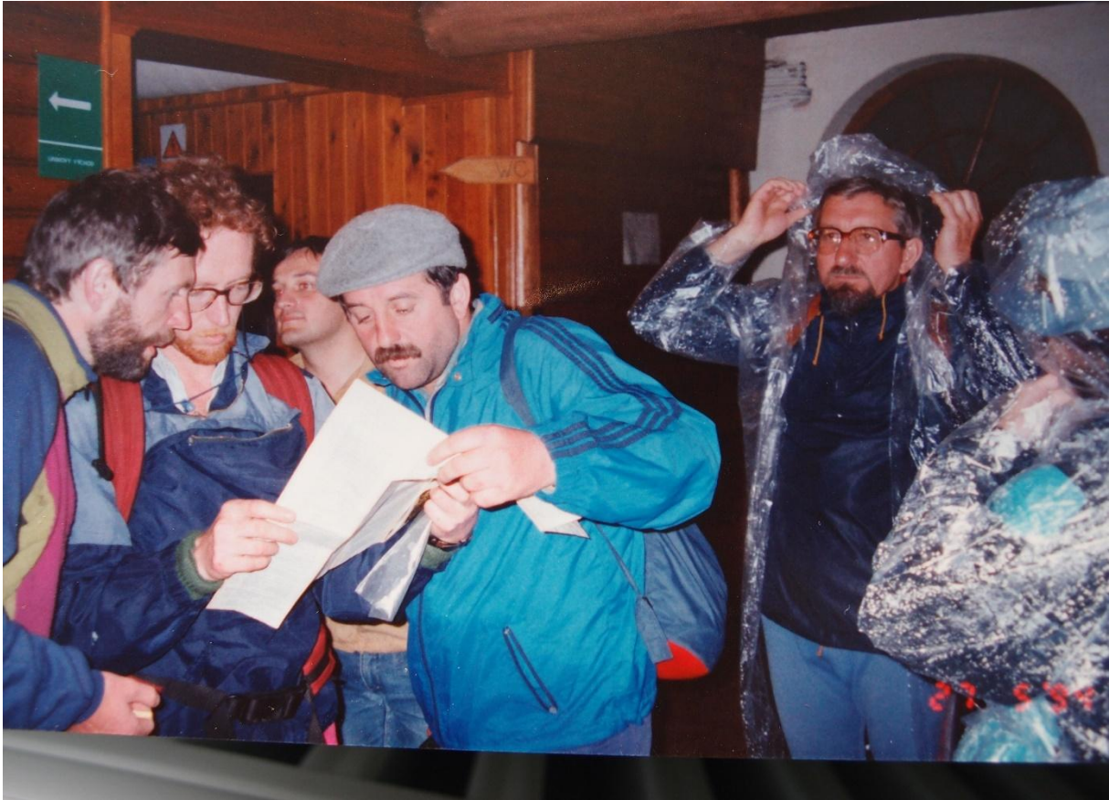
1994 – 12.ročník