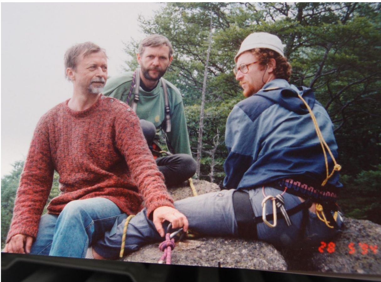
1994 - 12.ročník